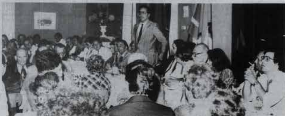
Mota Pinto aos militantes de Viseu: um social-democrata é ser a favor da responsabilidade nacional

No jantar, Mota Pinto defendeu, aliás, que o PSD não cometerá a irresponsabilidade de pôr em causa a coligação por interesses partidários que não se podem sobrepôr aos interesses do País, a não ser que se chegasse à conclusão de que o Governo não cumpria a sua missão. As tomadas de posição do líder social-democrata na sua visita a Viseu surpreenderam alguns que esperavam só ouvir falar de problemas locais. Mas o vice-prime-