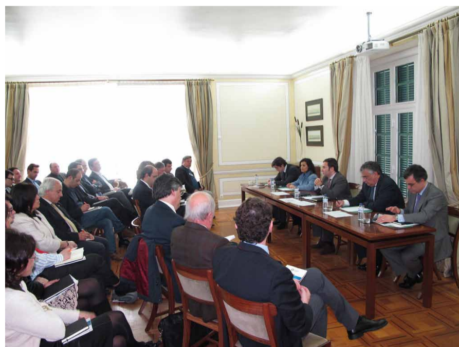
Na passada semana, estiveram reunidos, na Sede Nacional do PSD e em trabalho de preparação das próximas Autárquicas-2013, Deputados, Dirigentes locais e Autarcas do PSD do Distrito de Coimbra, com o Secretário-Geral nacional, José Matos Rosa e o 1º Vice-Presidente e Coordenador da CPN, Jorge Moreira da Silva.