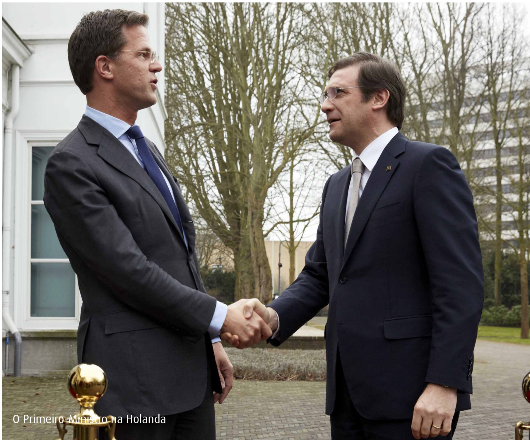
O Primeiro-Ministro na Holanda