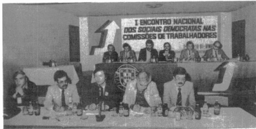
A sessão de abertura foi presidida pelo secretário-geral do PSD, António Capucho