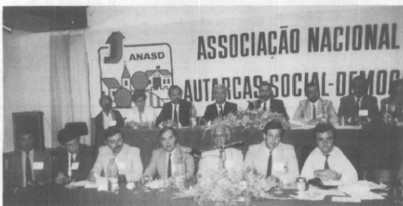
Aspecto da sessão de encerramento da II Assembleia Geral da ANASD, que decorreu no Porto, no passado sábado, e a que estiveram presentes, entre outros, os ministros Eurico de Melo, Fernando Nogueira e Valente de Oliveira. Durante os trabalhos foram eleitos os novos órgãos nacionais da organização.