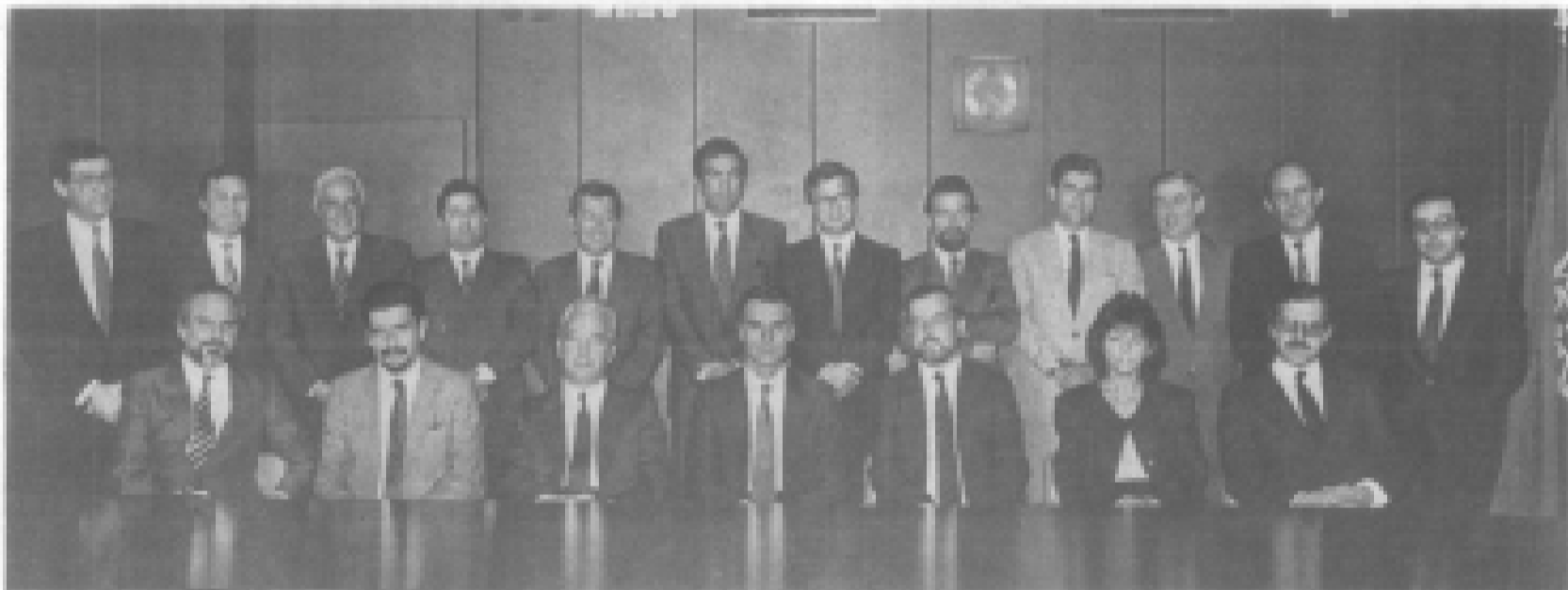
O plenário dos ministros do XI Governo Constitucional